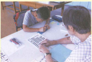
点字ボランティア体験

今年は29人が参加しました。障がいのある方とボランティア活動をした人は「障がいがある人の事を理解し、助け合うことが大切だと気づいた」、夏まつりのボランティア活動をした人は「協力できる事を積極的に行うことで1人でも多くの方の力になれることに気が付いた」などの感想があり、夏休みに貴重な体験をしてもらえたようです。