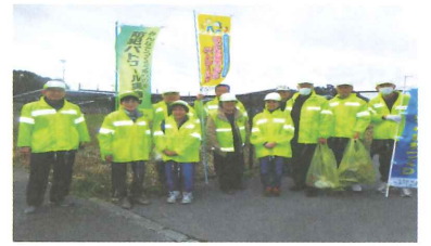
地域内をパトロールする隊員

少子高齢化が各地区とも進む中、隣近所のお付き合いが少なくなってきたのが現状です。今、地域では「私