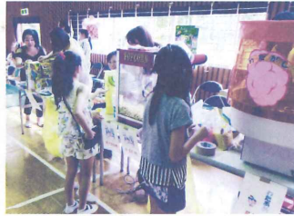
みなもとまつりの様子

これからも社会福祉協議会の携わる案件は、多岐にわたりますが、皆で力を合わせて努力を重ねてまいります。