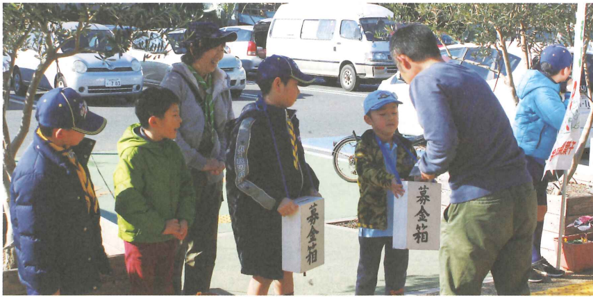
ボーイスカウトの皆さんによる街頭募金 あなたの優しさを地域のために

「赤い羽根共同募金」は、1947年(昭和22年)に始まって以来、「たすけあいの精神」のもと、地域の福祉活動に役立ってきた社会福祉法に基づく募金です。千葉県共同募金会東金市支会(事務局:東金市社会福祉協議会)では、平成30年10月1日から平成31年3月31日までの期間、赤い羽根共同募金運動を推進します。特に、10月1日から12月31日までを「募金強化月間」として実施します。昨年度は、7,146,654円の募金が集まり、そのうち東金市社会福祉協議会では今年度、千葉県共同募金会より、5,158,000円の助成を受け、敬老・金婚祝い、障がい者まつり、子育てサロン、法律相談などの地域福祉の推進に役立っています。