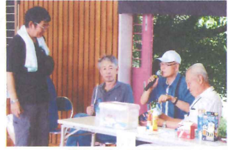
救護班として活動

社会福祉協議会は幅広い、どうすれば役立つのか、喜んでいただけるのか悩むことが多い。一人一人の生き方があり歴史がある。