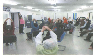
指導員による健康づくり体操

ぐるみ健康づくりの「地域コミュニティ活動」が活発になってきています。地域コミュニティ活動の重要性について行政との協働で、地域に周知啓発しながら色々な活動を実施しております。色々な活動の中で毎月実施している健康体操指導員による「健康づくり体操」や地域内の安全