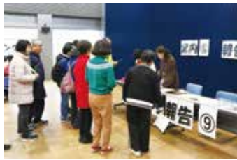
災害VC立ち上げ訓練の様子

今後、1月に災害VC立ち上げ訓練を計画しています。この訓練では、受付から始まり活動を終えて報告するまでの流れや、オリエンテーションやマッチングといった各セクションの役割を学び、実践します。新型コロナウイルス禍における対策なども一緒に考えていきましょう。