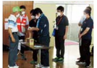
段ボール間仕切りの組み立て研修

8月に「新型コロナウイルス感染症に対応した避難所運営研修」が東金市消防防災課主催で開催され、参加しました。目的は「新型コロナウイルス感染症の拡大により、自然災害が発生し、避難所を開設する場合には、従来までの避難所対応とは異なる対応が求められる。そこで、避難所担当者が感染症拡大防止策として新たに整備した物資等を適切に活用し、円滑な避難所運営にあたることのできるよう、避難所施設や物資等の活用方法の習得を図る」という研修内容で、非接触型体温計を使用した体温測定や避難世帯ごとの区画