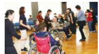
ふれあいパーティーで車イスダンス

役員が話し合いを重ね開催方法を模索してまいりましたが、現状皆様の安全を最優先としての判断でございますので、ご理解をよろしくお願いいたします。