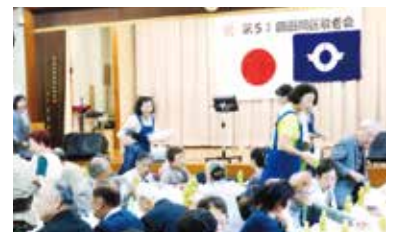
ボランティアの方々も大忙し...のはずでした

代替施設が現状市内に見当たらず、いつ利用不可になると戦々恐々としていますが、椅子に座って飲食可能な施設の建設を是非とも行政にお願いしなくてはなりません。