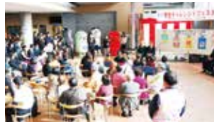
来年に向けて話し合います

今年度は残念ながら中止となりましたが、来年度は感染症対策を行い、形を変えて継続できるよう実行委員会で話し合いを進めていく所存です。