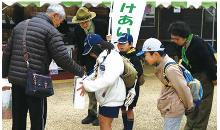
ボーイスカウトの皆さんによる街頭募金 あなたのやさしさを「とうがね」のために

また、共同募金は、千葉県内の福祉施設や団体にも助成され、新型コロナウイルスの影響による、困窮や孤立などの新しい問題への対策にも使われたり、昨年度千葉県を襲った台風などの災害時にも活かされる募金です。あなたのやさしさでつながりをたやさない、もっと住みやすい地域になりますように、共同募金運動に今年もご協力をよろしくお願いいたします。