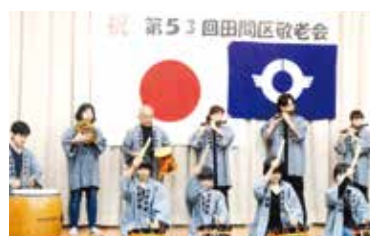
午後の芸能等懇親会

当協議会は総勢37名(除く理事・評議員)で4部会に分けて年間行事を粛々と行っておりますが、今年は春以来総務会会議を除き全て中止との結果となっております。普通の生活に戻れる日がまち遠しい限りです。市民皆様の御健康をお祈り致します。