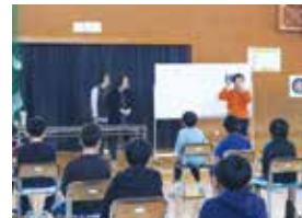
聴覚障がいについて(東小)

他にも、「視覚障がいについて」や「昔遊び体験」なども福祉教育として取り組んでいます。講師を含め、福祉施設や地区社会福祉協議会、ボランティアなどたくさんの方からご協力をいただいています。子どもたちが