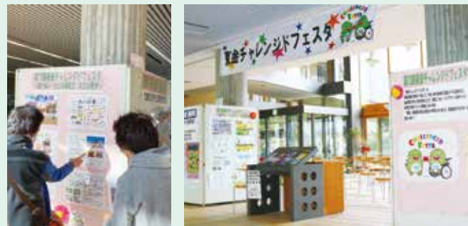
PRポスターを掲示しました

このたび、PRポスターを収めた啓発冊子を作成しました。社会福祉協議会や市内の福祉スタンドなどで配布しています。ぜひご覧いただき、「障がい」について身近に感じていただければと思います。