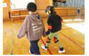
高齢者疑似体験(城西小)

11月10日、城西小学校5年生の福祉教育を、ゆりの木苑、城西地区社協、大和地区社協、上宿さくら会の協力のもと実施しました。