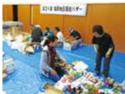
福祉バザー 値付けのようす

昨年はコロナ禍の影響で毎年実施している「ふれあいお楽しみ会」やバスを使っての「史跡めぐり」等が実施できませんでした。