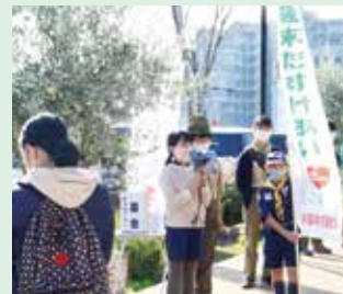
みりの郷東金にて