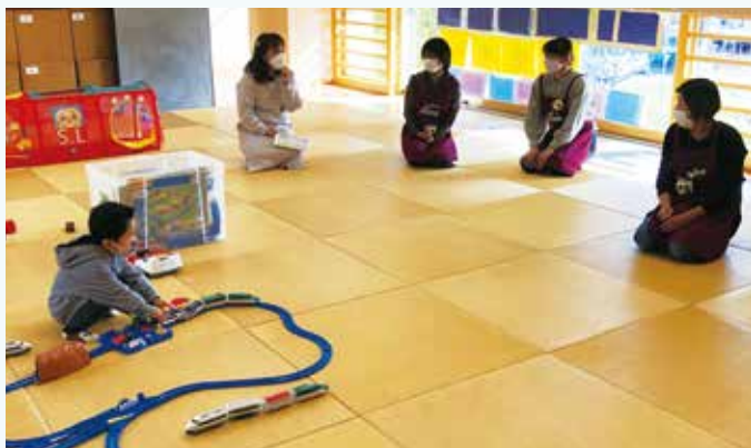
主任児童委員がお待ちしています。