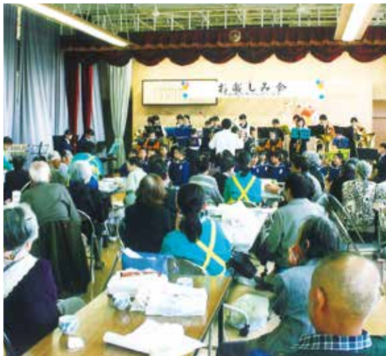
来年度は皆様とお会いできるよう

コロナ第7波の影響で当地区の一大イベントである「お楽しみ会」が過去3年間開催出来ず、地域の高齢者の皆さんには残念だったと思いますが、私たち社協メンバーも大変がっかりしております。会場などの都合により苦渋の決断をして中止としました。来年度は城西地区の元気な皆様とお会い出来る様に何としても開催したいと考えておりますので楽しみにお待ち下さい。