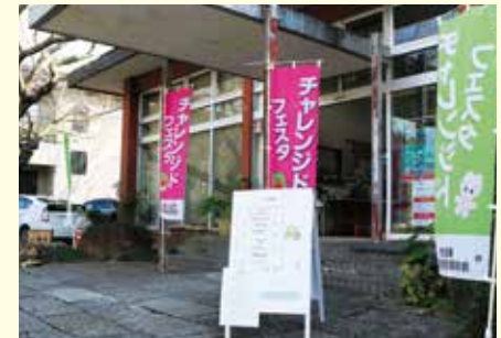
八鶴館さくらホールにて3年ぶりのイベント