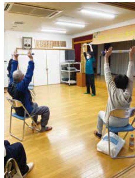
座ったままできる体操で気軽に健康づくり