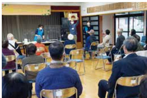
栄養士による実演「オリーブオイルで健康増進!」

健康に関する講話や気軽にできる体操など、様々なメニューで正気地区の高齢者の健康づくりを応援する「通いの場 元気ステーションまさき」。次回は1月31日（火）家徳公民館にて予定しています。