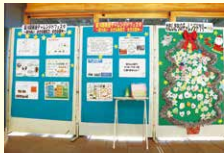
PRポスターと私たちのチャレンジドツリー