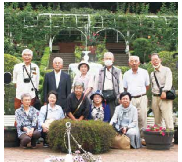
退任者へ感謝とお礼を込めて

「読売巨人軍発祥の地」を見て昼食に谷津干潟の自然観察センターに徒歩で向かいました。あいにくこの時期野鳥が少なく入館すること無く、折り返しました。欠席の方のお土産にバラの苗を買うため、八千代の京成バラ園経由で調達しお土産としました。