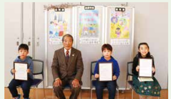
作品とともに皆で集合写真

12月10日、ふれあいセンターにおいて入賞作品の表彰式を行いました。最優秀賞の作品はポケットティッシュにしてふれあいセンターで配布しています。