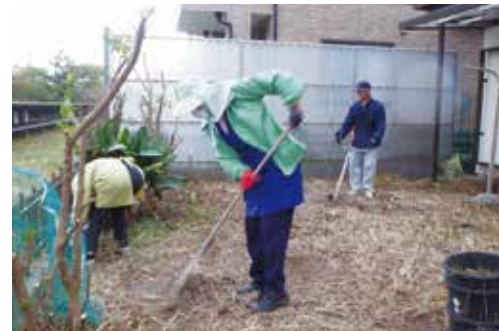
ライフサポーターによる庭の草刈。ご近所同士で助け合います!