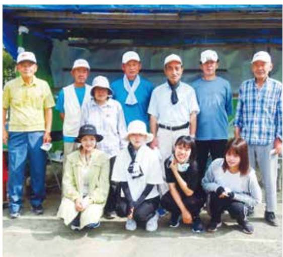
サービ斯拉ーニング学習にて

サービ斯拉ーニング学習は、城西国際大学看護学科が「地域社会のニーズに沿った地区活動に参加し、地域に暮らす市民として地域に貢献できる素養を身につけ看護専門職としてのスキルを発揮する上の基盤とし、看護学を学ぶ準備学習とする」ことを目的として実施され、丘山地区社協では看護学部1年生4名を受け入れることとなりました。