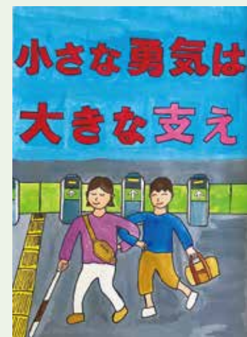
蛸原 春真さんの作品

「子どもがささえる福祉のまち」をテーマにポスターコンクールを実施し、みなさん思いの作品計17作品を応募してくれました。