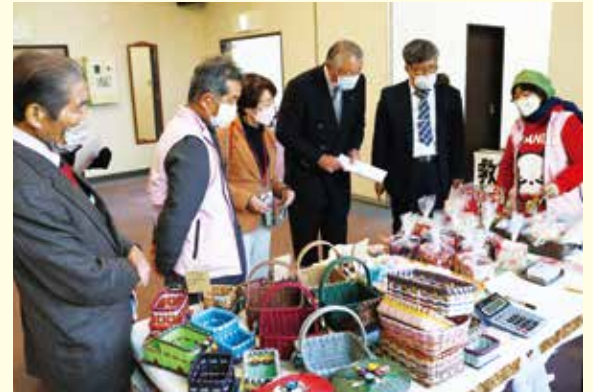
各ブースでは、お客さんに商品や活動を説明しました

また、ふれあいセンターでは、PRポスターを掲示。今年度より“私たちのチャレンジドツリー”を設置し、皆さんの夢やメッセージを書いたオーナメントを飾りました。その場でもメッセージでの飾り付けができるようにし、多くの方の夢いっぱいので完成しました。