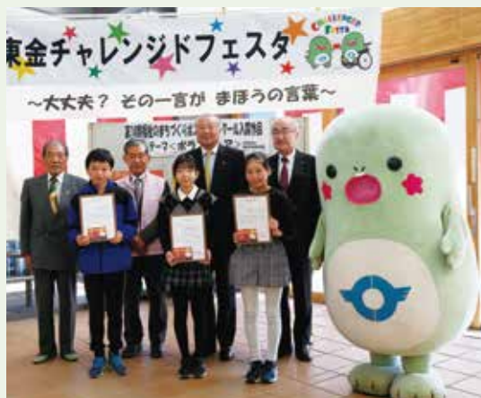
ポスターコンクール入賞者

12月3日、ふれあいセンターにおいて入賞作品の表彰式を行いました。最優秀賞の作品はポケットティッシュにしてふれあいセンターで配布しています。