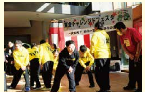
ダンスパフォーマンス

チャレンジドとは「挑戦する人＝障がい者」という意味を持ちます。チャレンジドの木の作成やステージパフォーマンス、様々な体験などを通じて東金に関わる皆さんが交流し、みんなでつくるふれあいの多いチャレンジドフェスタになりました。