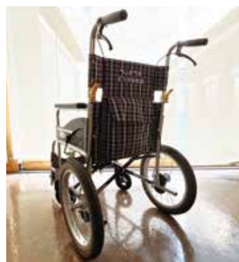
介助型を購入しました

引き続きボランティア・市民活動センターでは切手の収集や整理などの「ちょボラ」をしていただける方を募っています。