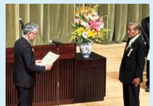
千葉県共同募金会東金市支会が受表彰