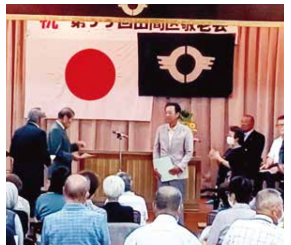
第55回田間区敬老会

田間地区社協として4年ぶりに敬老会を開催することが出来ました。 令和6年3月末で閉館となる老人福祉センターで9月9日(土)に、前回よりは大幅減でしたが約130名が集い、市長をお招きしての式典及びプロによる演芸を行いました。出来れば何の制限も無く行いたい思いでした。未だコロナが100%治まった訳では無いため飲食は伴わず、2時間と短時間ではありましたが、久しぶりの再会に参加者は喜んでいただけたと自負しております。 全国ではこの敬老会開催に関し、後継者不足、参加者の年齢引上げ(80才以上)等様々な意見が有り、中止にする所が多いと報道されておりました。確かに当地区でも参加者の88%が高齢者でした。 しかし、敬老をお祝いする心は、後世にも是非とも継承していきたいと永くこの敬老会が続くことを願っております。 そのためにも若返りを含め明るく活発な田間地区社協とし活動していく覚悟です。今後も当会へのご指導・ご協力をよろしくお願い申し上げます。