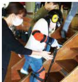
段差を上がるのが大変

東金市社協では高齢者疑似体験のほかに、車いす体験や視覚障がい体験も行っていますので、ぜひお問合せ下さい。