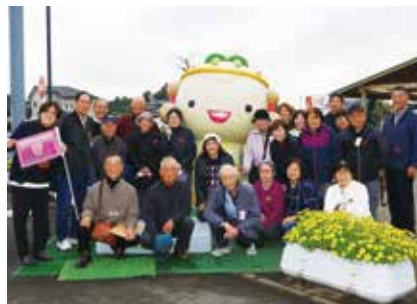
笑顔あふれる楽しい一日となりました