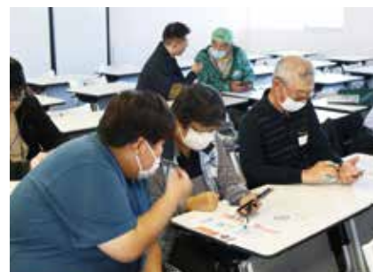
マンツーマンで楽しく学びました