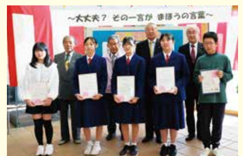
サブタイトル入賞者