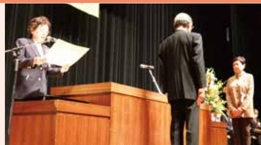
日頃のご尽力に感謝

式典では日頃の活動に対して、以下の方々に真行寺会長より表彰状・感謝状を贈呈いたしました。