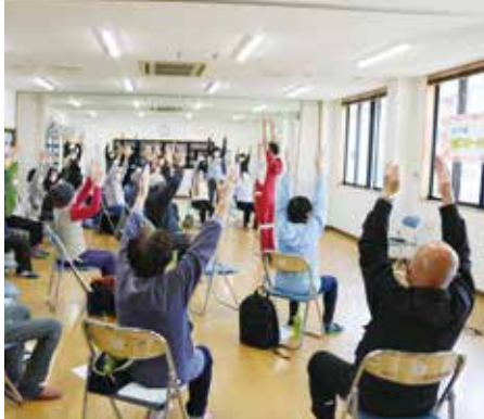
みんなで体操、体も脳も活性化

「正気地区介護予防・生活支援サービス推進委員会」では、地区の高齢者のみなさんの健康づくりと社会参加を支援しようと、家徳公民館を会場に2ヶ月に1度(奇数月)通いの場を開催しています。