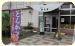
和食 かしま ☎52-5526