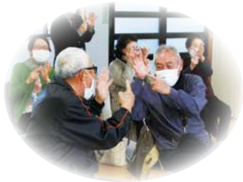
仲間っていいなあ

「行ってみたいけど移動方法がなく…」そのような方も参加できるように、今年度からは地区内の高齢者施設のバスを利用し、個別送迎を行う取り組みも始めています。