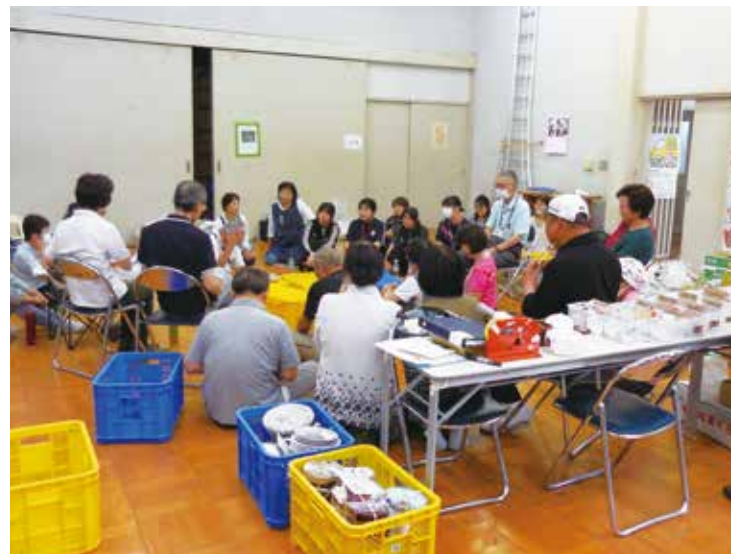
福祉委員や学生と値付けをしました

本年度3年目を迎える福祉教育推進団体として「つながる」をキーワードに活動してきましたが、福祉バザーの活動を通して、異年齢間のコミュニケーションの取り方の大切さや、ネット社会と言われる中でも人とのコミュニケーションは、笑顔が一番であることを実感しました。