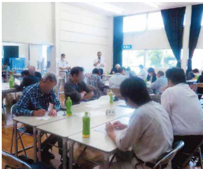
地域福祉活動計画委員会

正気社協は社協役員、食生活改善会、民生・児童委員、各種団体、ボランティアが中心となって、今年度は「みんなが主役・みんなを支える正気」を合言葉に、つながりを大切にする活動を行っています。