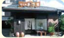
蕎麦口福 東京庵 ☎52-3521