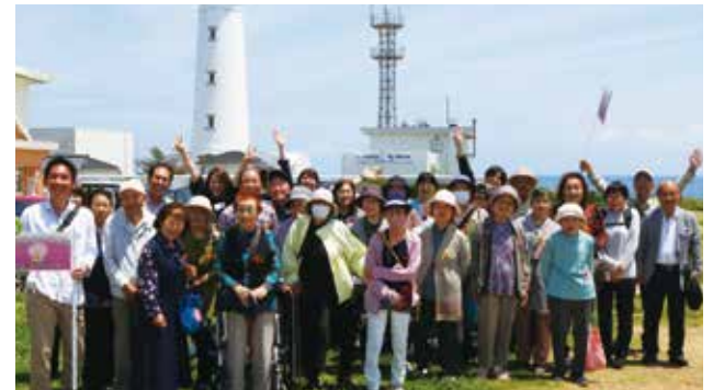
「お楽しみバスツアー」春は銚子へ

社会福祉協議会では東金市からの委託を受け、生活支援コーディネーターを配置し、高齢者のみなさんの「介護予防・社会参加・生活支援」を進めています。また、地域のみなさんと一緒に「支え合いの地域づくり」に取り組んでいます。高齢者のみなさんの「やってみよう」「ちょっと困っている」などの声をぜひお聞かせください。