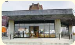
カフェ&レストラン とっちゃん ☎53-3615