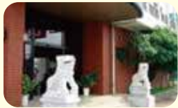
中国料理 蓬菜閣 ☎52-1122