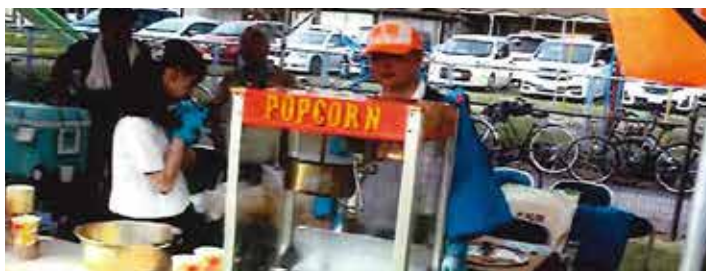
第13回ふれあい大和祭

7月27日、第13回ふれあい大和祭が西福俵西公園にて開催されました。運営役員を始め関係役員は、前日から準備を整え、当日午後3時から例年どおり、焼ソバ・かき氷などの各種模擬店が並び、玉入れ・子ども山車・最後は踊りで締める各種の催しで、参加者全員が祭りを楽しむことが出来ました。