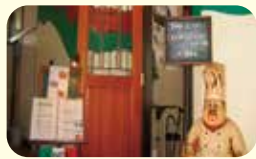
レストラン ポンテ・テルツォ ☎52-0975