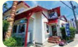
リトルチャイナ 豊 ☎55-2353