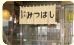
とんかつ・和食 みつはし ☎55-0933