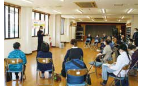
認知症や骨粗しょう症について学ぶ機会に

秋には「お楽しみバスツアー」も予定しています(開催日時や内容については、回覧等でお知らせしています)。