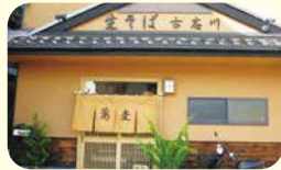
生そば 古志川 ☎52-3549