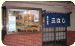
寿司割烹 三はし ☎54-0384