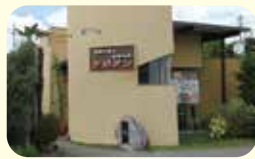
中華海鮮市場 アジアン ☎53-1700