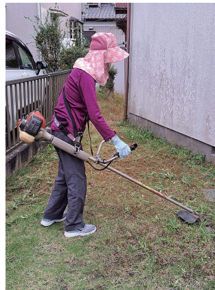
自分自身の生きがいにも

暮らしの「ちょっとした困りごと」を住民ボランティアが有償でお手伝いする「サポーター」が登録されており、庭の草取り、簡単な部屋の掃除・片