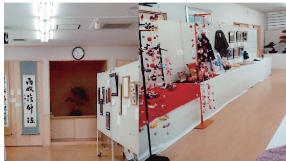
絵画や手芸の力作が並びました

今年で11回目を迎えます。11月8日～9日に開催します。ぜひ力作を観に来て下さい。