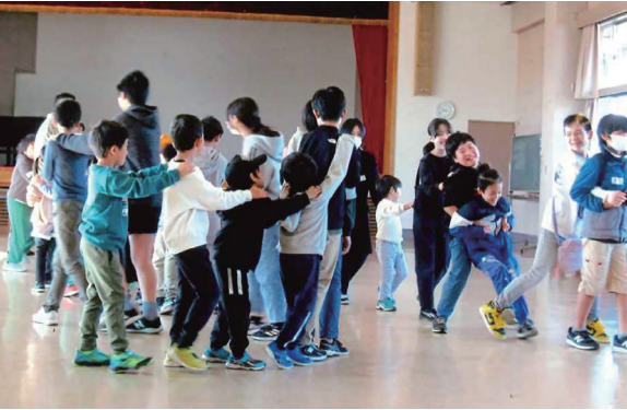
じゃんけん列車で遊びました

地域であたりまえに通っていた東金幼稚園が、2024年度に閉園しました。これまで園児のダンスを観せてもらったり、高齢者も一緒になってゲームもしたりして楽しい時を過ごしてきました。とても残念に思いました。