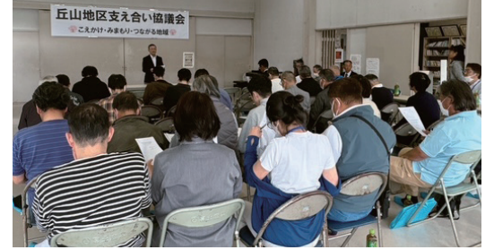
丘山地区支え合い協議総会

高齢化率が38.2% (令和7年4月1日現在) を超える丘山地区で、昨年10月に「丘山地区支え合い協議会」が立ち上がりました。協議会へは、地区社協をはじめ地区の各種団体が参画しています。地区に暮らす高齢者のみなさんが安心して暮らしていくために、どのような活動が必要か、1～3月にかけて実施したアンケート調査結果を参考に、話し合いを進めています。