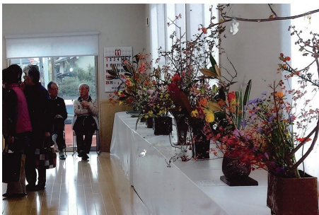
華やかな生け花が陳列されました