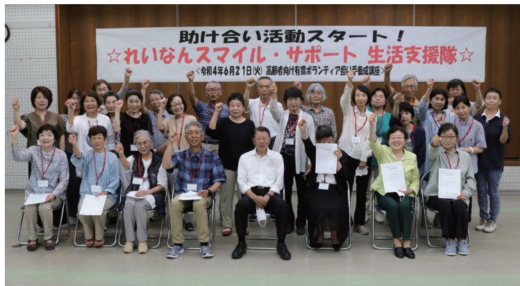
「スマイルサポート」設立会

嶺南地区社協では、生活支援コーディネーターの働きかけにより令和3年度に「第2層協議体」を設置し、話し合いをすすめました。その中で、少子高齢化が急速に進み一人暮らし高齢者や高齢者のみ世帯の増加や孤立が課題となりました。結果として協議体では困ったときにお互いさまで支え合う「支え合いの地域づくり」を進めることとなり、令和4年6月に助け合い活動「れいなんスマイルサポート生活支援隊」がスタートしました。