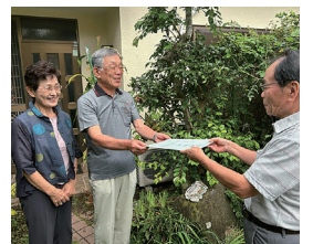
民生委員さんがお届けします