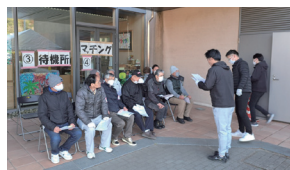
ボランティアをマッチング