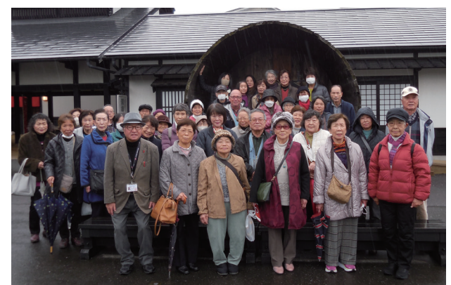
ヤマサ醤油工場にて

今後も、バザー、高齢者疑似体験授業サポート、ささえあいサービスなど、豊成地区社会福祉委員が一丸となって進めていきたいと思っております。