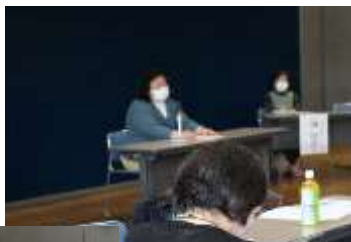
おはなしトントン