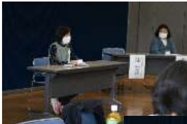
生活支援そよかせ