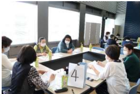
交流会にてみなさん話しています