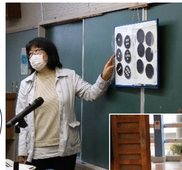
点字の読み方を教えてもらいました

ボランティアセンターでは、学校だけでなく、地区や会社などでの福祉に関する勉強会などのお手伝いもできますのでご相談ください。