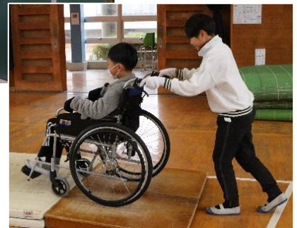
車いすの操作を覚えました