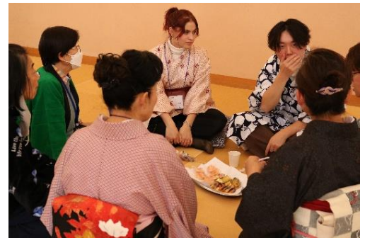
楽しく交流が出来ました

希望者には和服を着付け、和の雰囲気を感じてもらいながら、東金クイズ、自己紹介、そしてお茶とお菓子でゆったりとしながら、お国自慢の食べ物や、東金での暮らしのことなど、身振り手振りも混ぜながら話に花が咲きました。