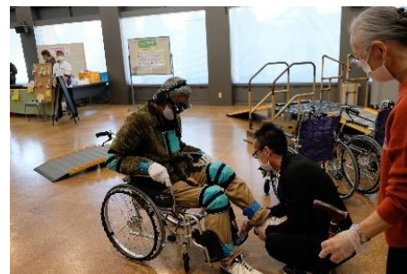
ボラセンは、車いす体験と高齢者疑似体験を行いました

来場者は361名。お土産の丸餅、クイズに答えて豪華な(?)賞品を手にして、楽しんでいました。